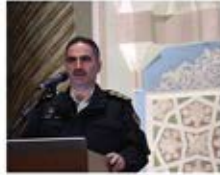
سرهنگ تورج کاظمی رئیس پلیس فتا پایتخت