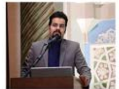
مهدی بینا مدیرکل فناوری‌های نوین ریاست جمهوری