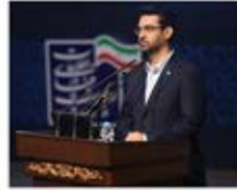
محمدجواد آذری جهرمی وزیر ارتباطات و فناوری اطلاعات