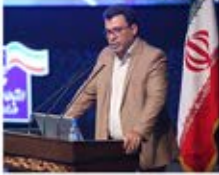
سرهنگ رسول لطفی رئیس مرکز عملیات فتا