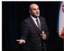
مهدی جبرائیلی دبیرکل جامعه کارآفرینان اتحادیه اروپا و آسیا