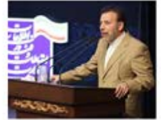
محمود واعظی وزیر ارتباطات و فناوری اطلاعات